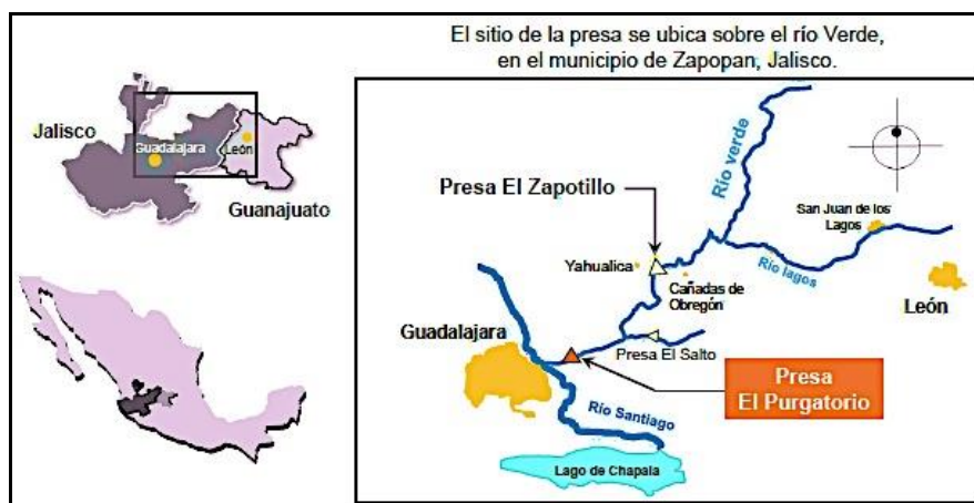
Conagua, 2017, Mexique.

La lutte actuelle contre le barrage Zapotillo est d'échelle régionale car elle mobilise la région du Jalisco (Mexique) appelée "Los Altos" et la Zone Métropolitaine de Guadalajara (4 millions d'habitants). En plus de la tension politique qui a été créée entre la ville qui a besoin d'eau (Guadalajara), il est prévu un transfert interbassin vers la ville de León (près de 2 millions d'habitants).